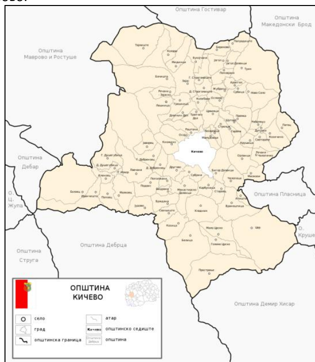
Мапа на населени места на подрачјето на општина Кичево 17

Општината Кичево се граничи со следните општини: од северна страна со општина Гостивар, од источна страна со општините Македонски Брод, Пласница и Крушево, од јужна страна со општините Демир Хисар и Дебарца, и од западна страна со општините Вевчани, Центар Жупа, Дебар и Ростуше – Маврово.